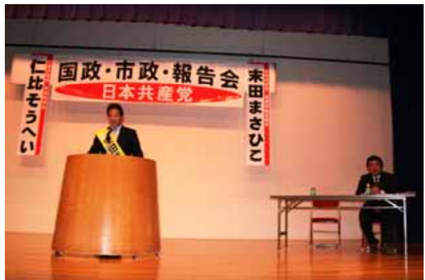
1月11日 国政・市政報告会(児島公民館)