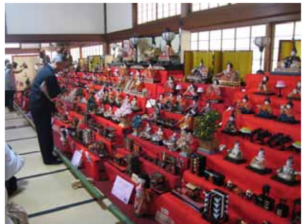
2月21日 児島雑めぐりオープン(野崎家別邸治暇堂)