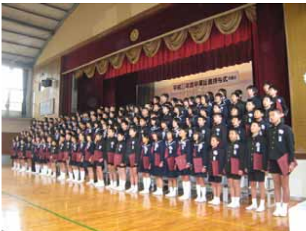
3月19日 倉敷市立児島小学校卒業証書授与式