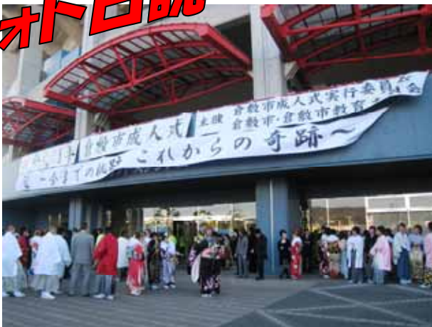
1月11日 倉敷市成人式(マスカット球場)